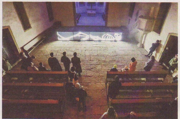
„Good Night“ 2021 in der Frauenkirche als Vorbote der Ornamenta.

Die Empfehlung der Runde zur Route der übermannshohen schwarzen Kugel aus gefärbter Merinowolle durch Lienzingen: Start an der Kirchenburg, also der Dorfkirche mit den Gaden, Endpunkt vor der Kelter an der Zaisersweiherstraße. Dort werde bei einem kleinen Fest das Ereignis gefeiert, so eine Anregung der Besucher. Da fänden sich sicherlich Liensinger, die „da etwas organisieren“. Dazwischen sollen alle „Ortsteile“ durchrollt werden - weniger nach einem festgelegten Plan, sondern mehr nach jeweiliger Lage ganz spontan: Herzenbühlstraße (historisch die Neustadt), Brühl, Gaiern-Neuwiesen, Friedrich-Münch-Straße beidseits der Zaisersweiherstraße und Vordere Raith/Spottenberg.