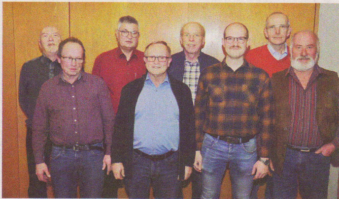
Die Vorstandschaft nach der Generalversammlung 2024

Anmeldung erforderlich unter 01525-8411138 oder hello@naechstenhilfe.de Weitere Programinfos unter www.naechstenhilfe.de